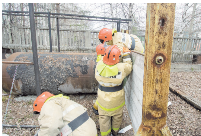
Забор на полосе

этапе нужно протянуть рукавную линию, подать воду и попасть в мишень с расстояния 10 метров, заполнить емкость водой до условного сигнала. А еще потушить огнетушителем поддон с огнем. Много раз видела, как другие выполняли это задание. Со стороны все кажется легко, на деле же двигаться в костюме тяжело и неудобно, закрытое забрало на каске ограничивает видимость. При этом у каждого из участников команды в руках – трехходовый раз-