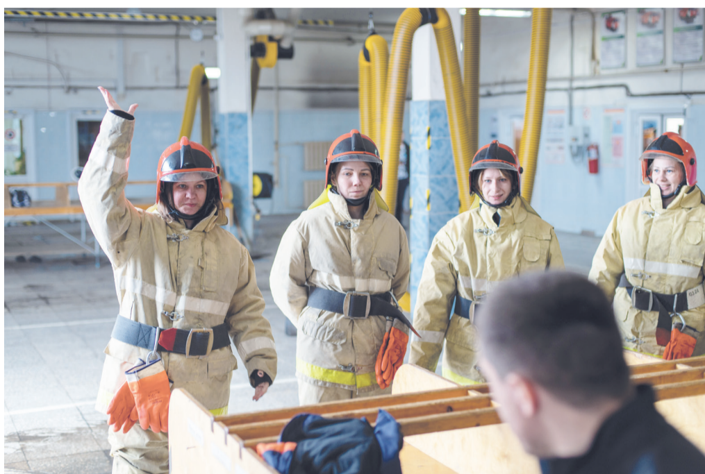
Надевание боевой одежды

Дальше уже шли непосредственно практические этапы. И первый из них – на время надеть боевую одежду пожарного. Время фиксируют по последнему