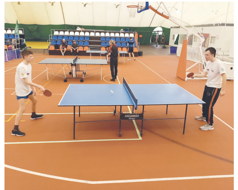
Кубок «Илима». Настольный теннис