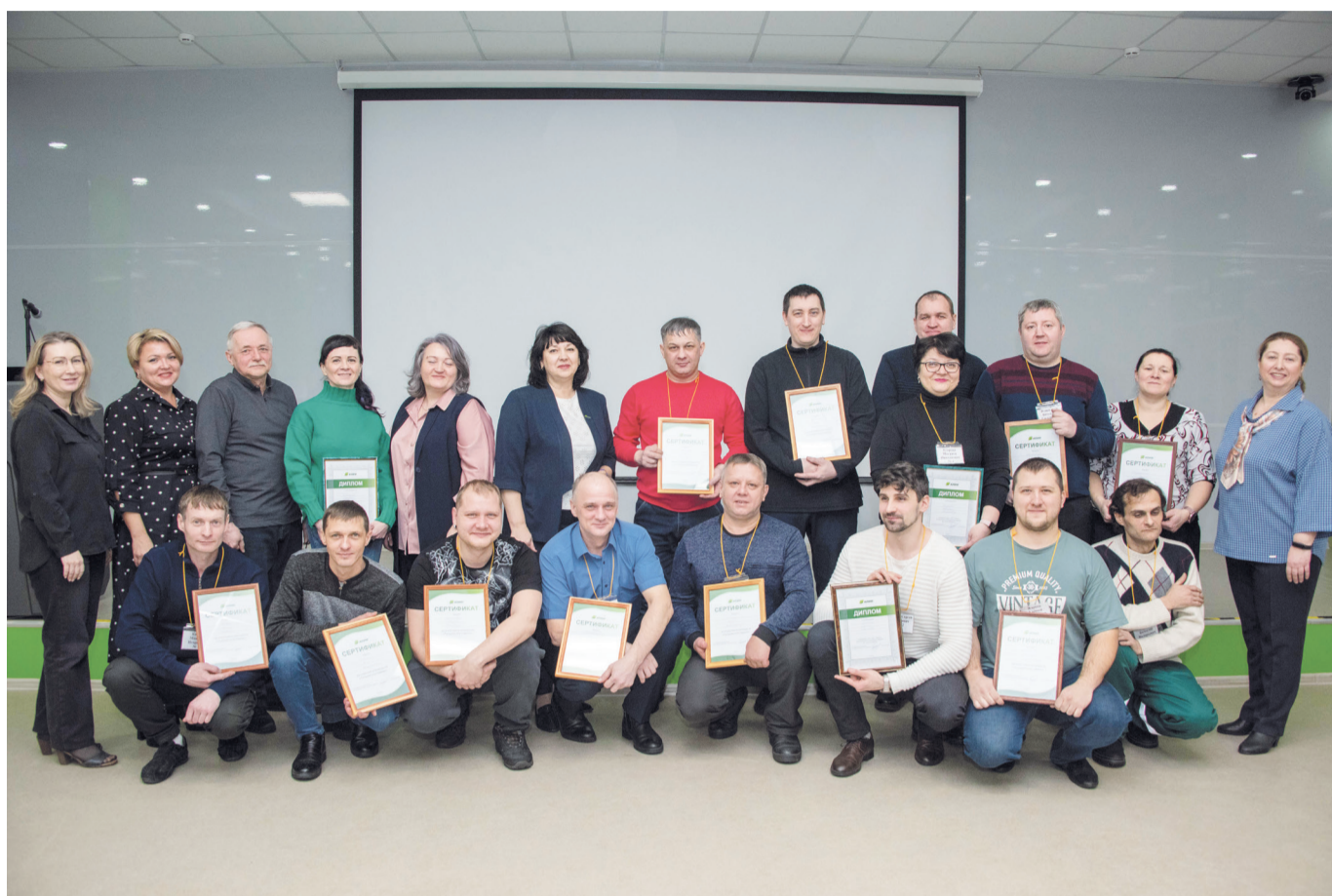
Участники конкурса наставников