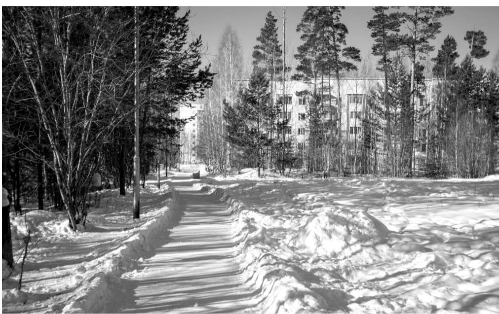
Общественная территория по ул. Карла Маркса, 61. Здесь будет парк

– К работам подрядчик должен приступить в мае. Его задача – устройство освещения и пешеходных дорожек. Тротуарная плитка будет укладываться таким образом, чтобы не повредить корневую систему ра-