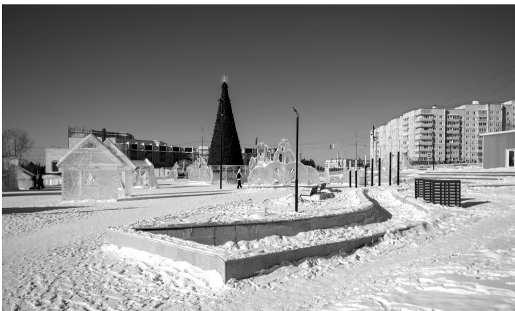
Площадь напротив ДК «Дружба». Ждем весны