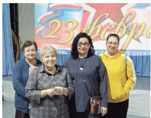
Вырученные от концерта средства переданы волонтерскому сообществу «Шьем и вяжем для фронта»