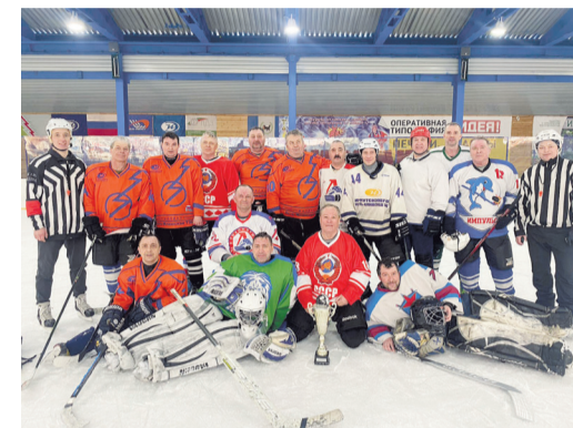
Победители – команда «Запад» – в оранжевой форме