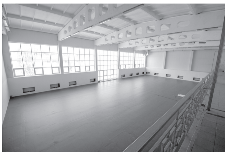
Зал для занятий спортивными единоборствами