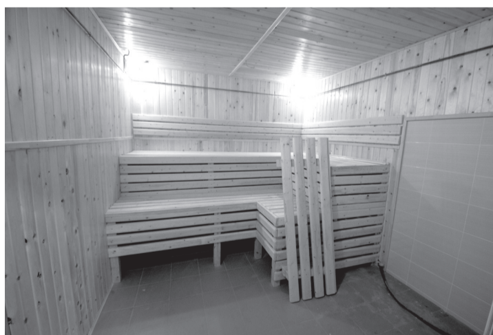
Одна из саун

подчеркивает Евгений Тэрыца. В частности, к ремонту в фойе только приступили. Здесь обновят пол, потолок, сделают новый гардероб.