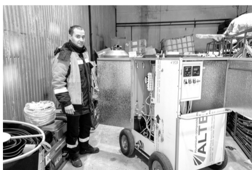
На сегодня все необходимое оборудование для ликвидации разливов на воде поступило в полном объеме. Пока температуры минусовые, оно хранится на складе