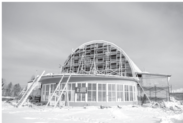
Завершаются работы по установке центрального витража, идут работы по отделке фасада здания

Сделано много, но еще многое предстоит сделать,