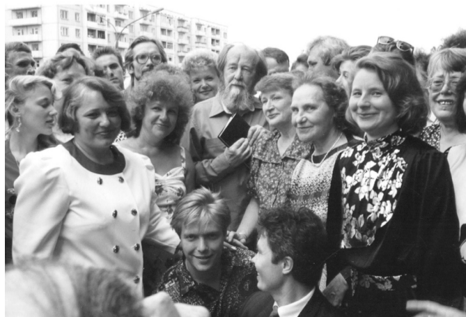
Встреча с Солженицыным

ансамбль русской песни и танца «Сибирячка», который уже через три года получил звание «Народный». А позже, работая уже во Дворце культуры «Дружба», известный ныне поколению устьилимцев как ансамбль «Сибирь» неоднократно это звание подтверждал.