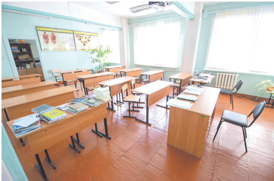
Современные аудитории техникума

УСТЬ-ИЛИМСКИЙ ТЕХНИКУМ ЛЕСОПРОМЫШЛЕННЫХ ТЕХНОЛОГИЙ И СФЕРЫ УСЛУГ БЫЛ ОТКРЫТ В 1992 ГОДУ, В 1994 ГОДУ ЕМУ БЫЛА ПЕРЕДАНА УЧЕБНО-ПРОИЗВОДСТВЕННАЯ БАЗА УЧЕБНОГО ЦЕНТРА УСТЬ-ИЛИМСКОГО ЛПК, РАСПОЛОЖЕННОГО В ПОСЕЛКЕ ПРИМОРСКИЙ