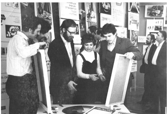
Творческая интеллигенция Усть-Илимска