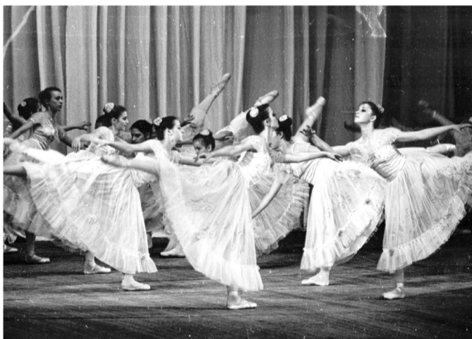
Ансамбль классического танца «Солнечные блики»

В 2023 году коллектив музея благодаря реализации национального проекта «Культура» открыл новую современную экспозицию об истории нашего города «Усть-Илимск. Здесь мечта превратилась в реальность».