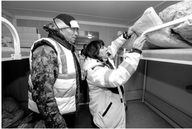
Качество ватных матрасов оставляет желать лучшего

Та рассказала, что насущная проблема одна – с холодильником. Мясорубку отдали в ремонт, а в остальном все нормально. – Сейчас доставляют хорошие продукты – овощи, мясо, рыбу и прочее. Удобрение идет на капусту, томатную пасту, говяжью печень. Запасов хватает. В основном бригада завтракает и ужинает. Средний ценник на полный обед