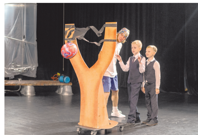
Усть-Илимский театр драмы и комедии. Детский спектакль с участием зрителей, 2023 год