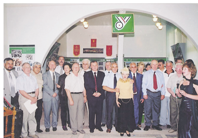
Открытие экспозиции УИ ЛПК «Стройка СЭВ», 2007 год