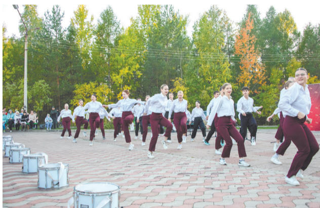
ДК «Дружба» открывает новый сезон, 2023 год