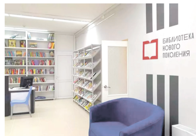
Библиотека нового поколения