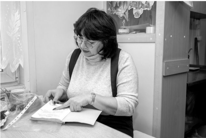
Книга жалоб и предложений. Жалоб нет

Традиционные ватные матрасы и подушки из холлофайбера – недолговечные и неудобные, а хорошо выспаться перед работой очень важно. Поэтому многие вахтовики привозят собственные спальные принадлежности.